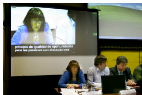
Conferencia con subtítulo en tiempo real

Subtitulado: a través de estenotipia informatizada, siendo la única herramienta capaz de transcribir en tiempo real la palabra hablada ofreciendo al colectivo de discapacitados auditivos toda la información con un 99% de fiabilidad en la transcripción.